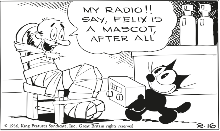
© 1936, King Features Syndicate, Inc., Great Britain rights reserved

exclusiva— van arrodonar l'èxit enorme que els acompanyava al cinema. La influència de tot aquest univers en els dibuixants espanyols va ser enorme. Malgrat que TBO, la revista autòctona més forta i de vida més llarga, no semblava que se'n ressentís i va rebutjar obrir-se en canal als nous estils —per exemple els globus—, sí que ho van fer alguns dels seus dibuixants. I també els de moltes altres editorials. Qui s'hi podia resistir?