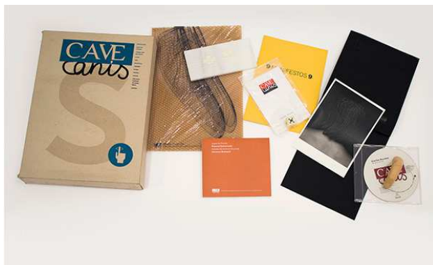
Revista Cave Canis, 1995-2000.