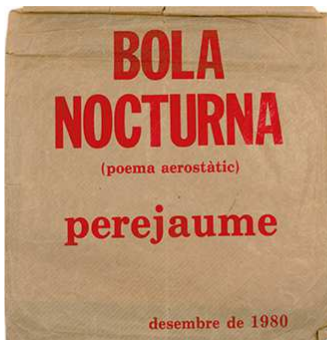
Bola nocturna (poema aerostàtic). Perejaume, Vicenç Altaió. Sabadell: Eczema, 1980.