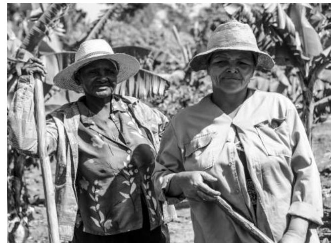
Campesinas - Manzanillo, Cuba (2015).