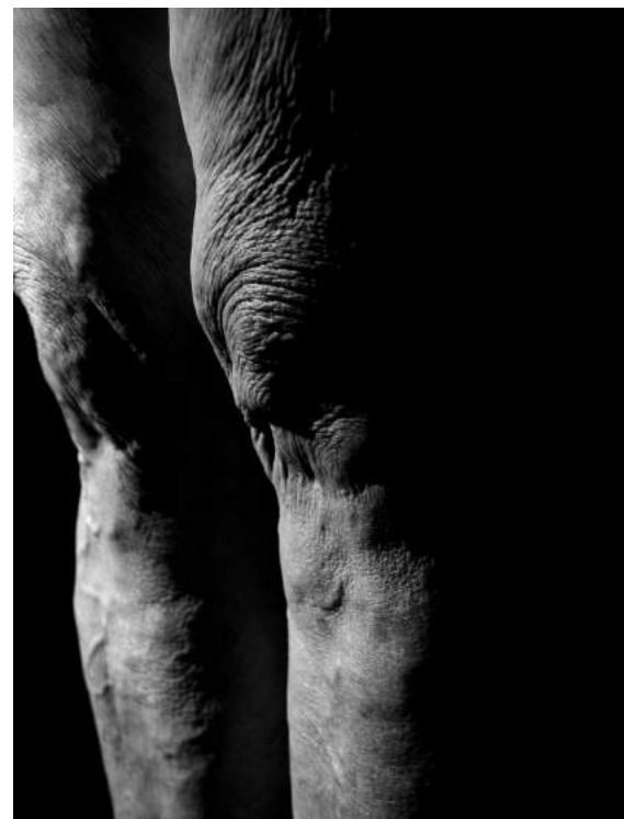
Transformaciones - Barcelona (2016). Autora: Judith G. Tur, Cuba.