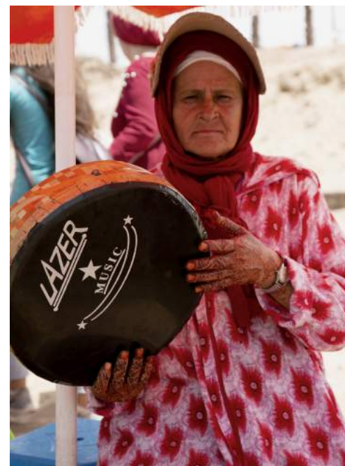
Recuerdo de una banda callejera - Casablanca, Ain diab, "Santuario Sidi Abderrahman", Marruecos (2017).