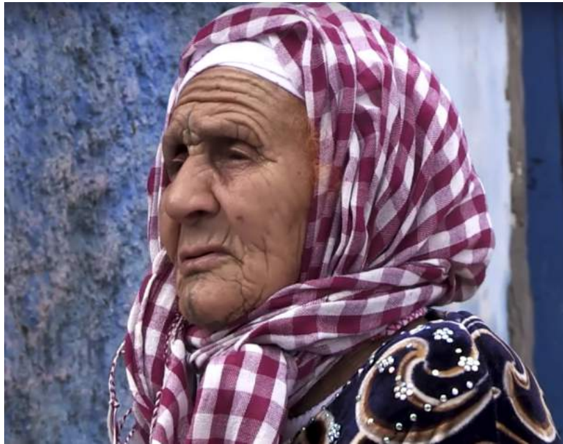
Mujeres de hierro - Casablanca, Marruecos (2017). Autor: Marouane Belfaqir, Marruecos.