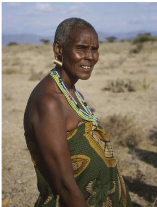
Vienen - Datoga, Tanzania (2002). Autora: Sania Jelic, Croacia.