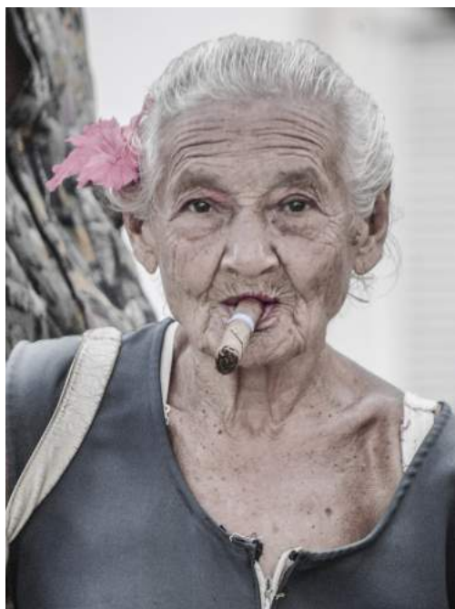
Mujer del parque - Santiago de Cuba (2014). Autor: Roberto Ruiz Espinosa, Cuba.