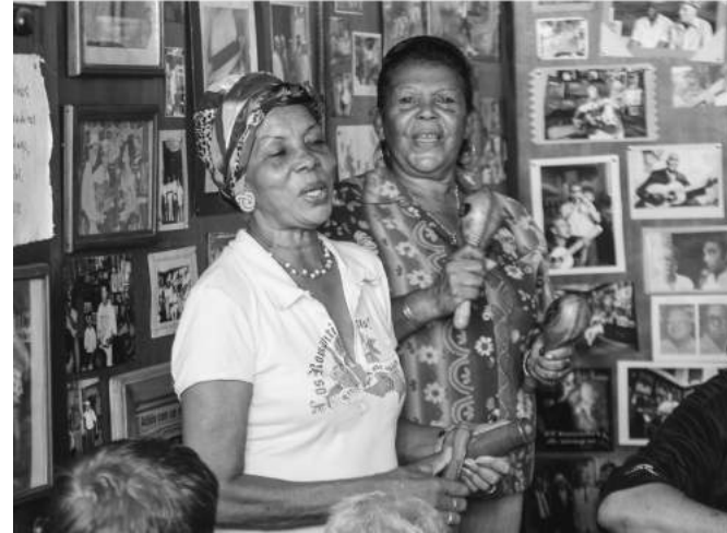
Trovadoras - Santiago de Cuba (2010). Autor: Roberto Ruiz Espinosa, Cuba.