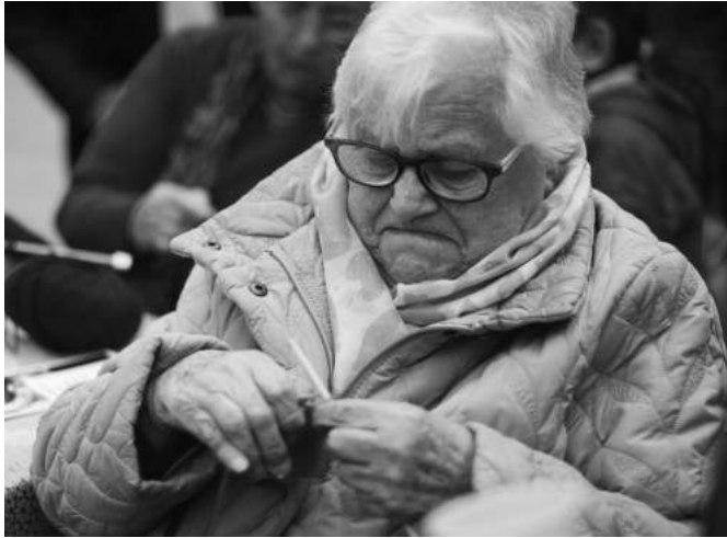
Pasiones - L'Hospitalet de Llobregat, Barcelona (2018). Autora: Paula Scarso, Argentina.