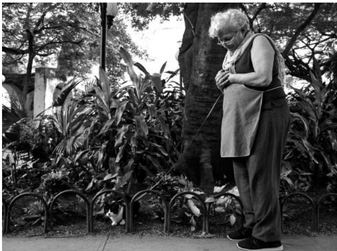
Mascota - La Habana, Cuba (2017). Autor: Roberto Ruiz Espinosa, Cuba.