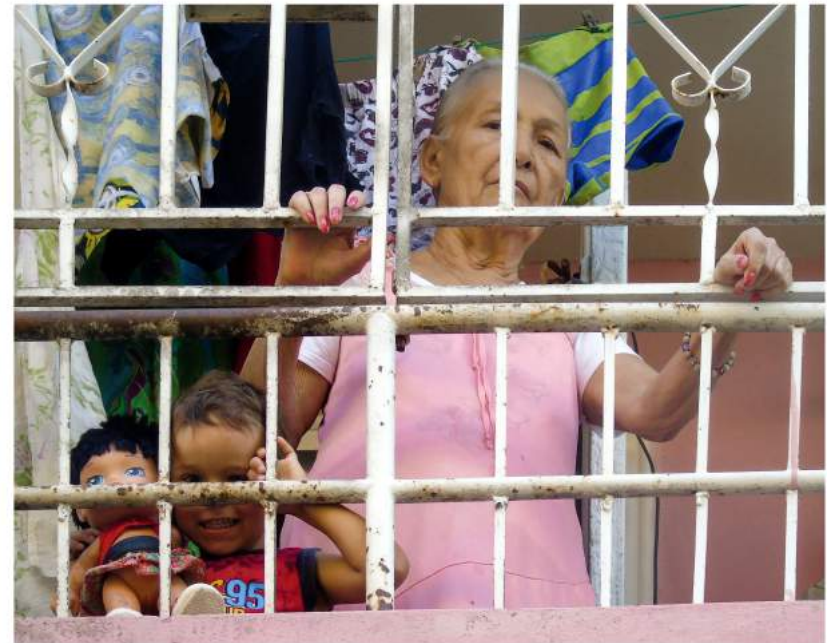
Sin título - Camagüey, Cuba (2017).