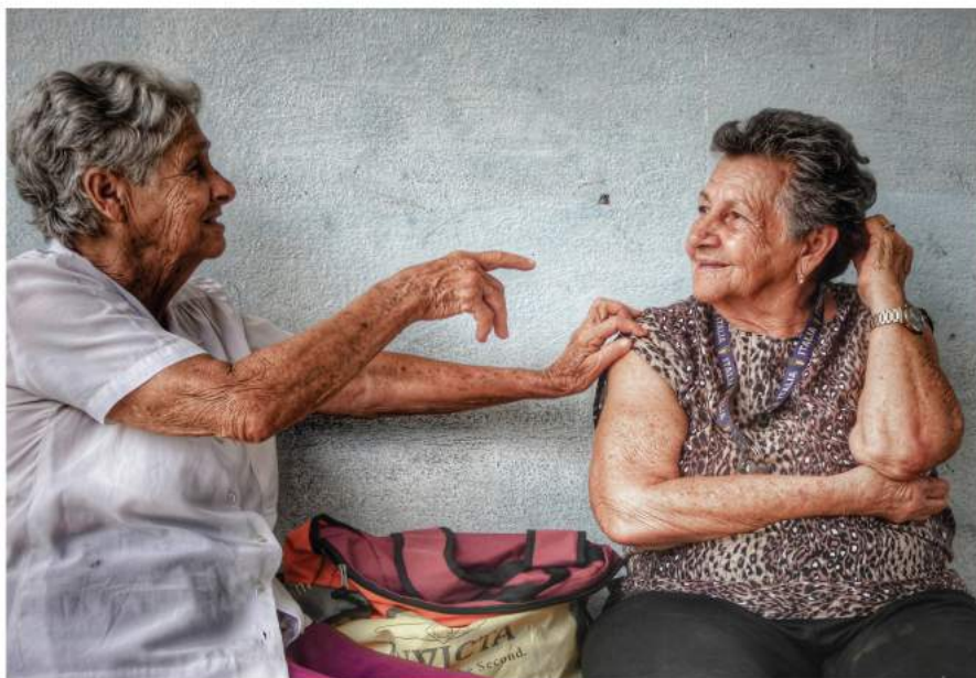
Al día - Camagüey, Cuba (2017). Autora: Rachel García, Cuba.