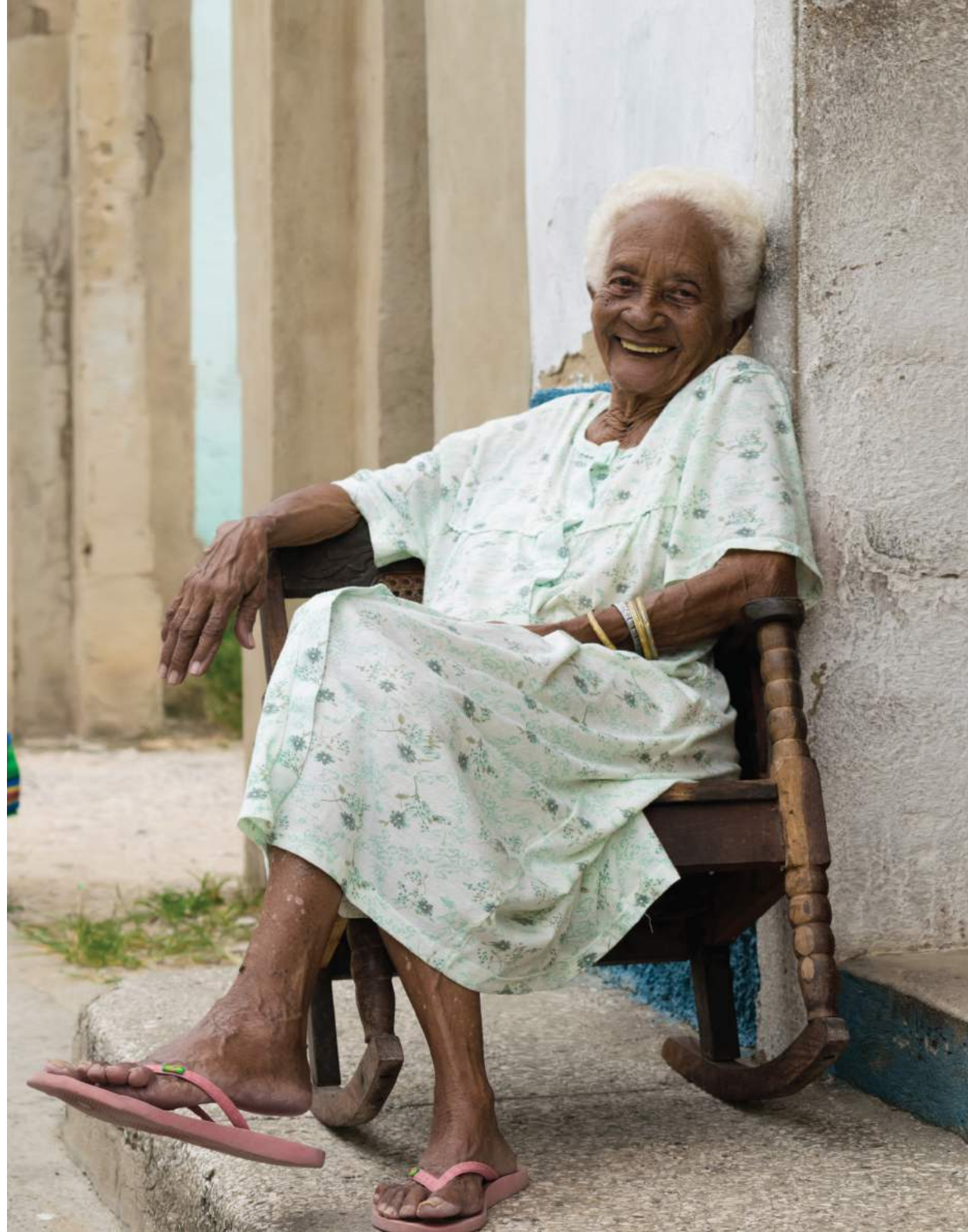
Afuera - Sancti Spíritus, Cuba (2018).