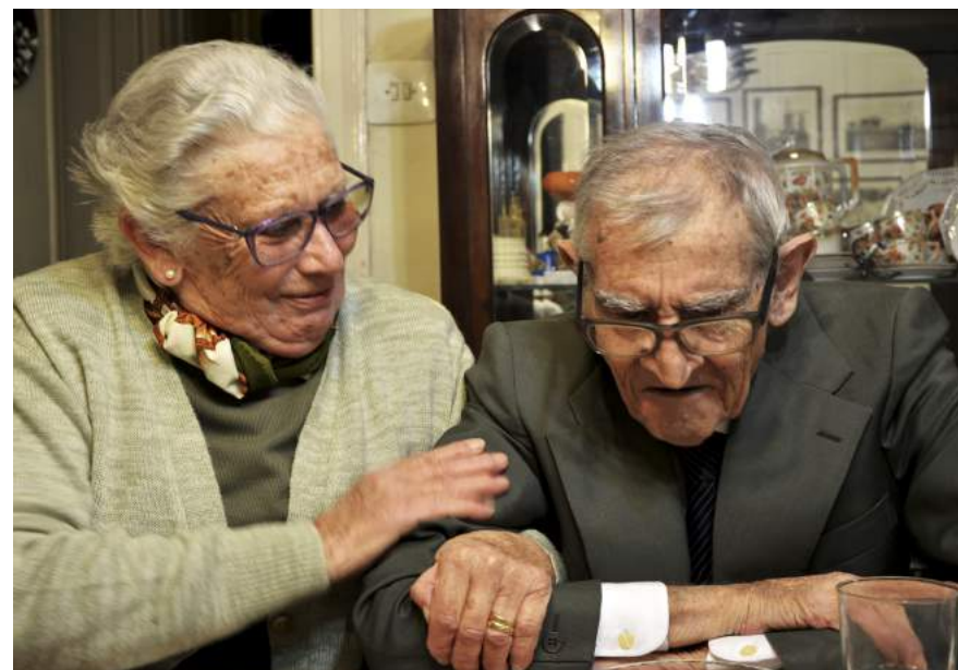
Hermanos - Barcelona (2018). Autora: Paulina Coral, Ecuador