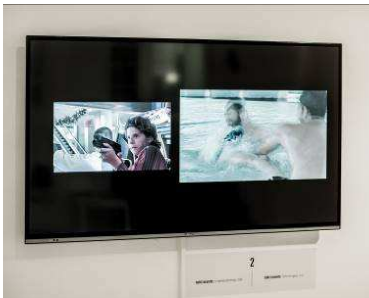
Isaki Lacuesta. Los films dobles .