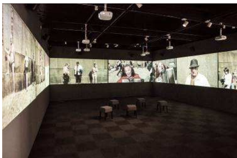
Isaki Lacuesta. Les imàgenes eco . Fotografía: Jorge Fuembuena