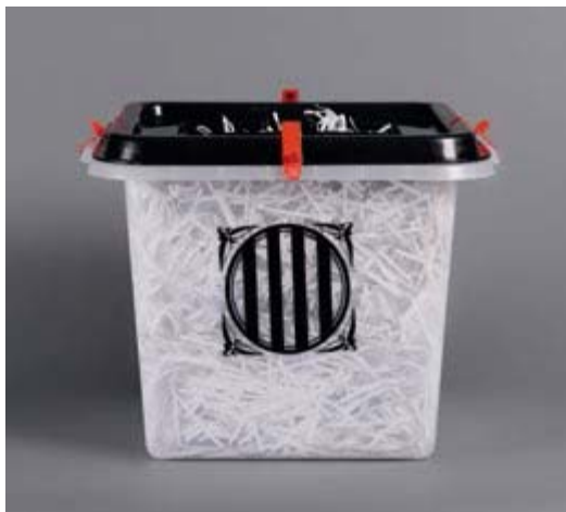
BIEL BARNILS CARRERA. Barcelona, 1976

La democràcia triturada. L'urna ja només conté paperetes trinxades, com trinxada està sent la democràcia a Catalunya, la voluntat del poble passada per la trituradora... La trituradora de paper utilitzada per l'administració o les empreses serveix per fer impossible la lectura de les informacions que conté, esborra la memòria.