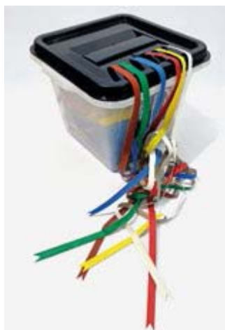
JESÚS GALDÓN. Barcelona, 1971

Urna pintada en negre, 4 filferros, 4 gravats enrotllats, 4 paquets de plàstic, filferro d'arç. Una urna pintada de negre amb quatre gravats que l'artista va enviar als presos polítics abans de Nadal i que van ser retornats a principi d'any. Els paquets rebutjats, envoltats del filat que oprimeix, en denúncia d'una injustícia d'estat.