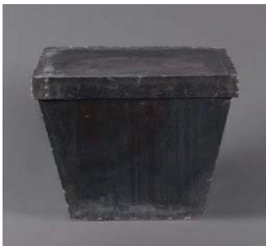
GABRIEL. Badalona, 1954

Qui pot ser obligat no sap morir. L'urna de Gabriel és una urna funerària; una urna de plom. El plom de la força i la violència atrapa les cendres de la llibertat que es troben dins l'urna. El títol de l'obra fa referència a una tragèdia de Sèneca que condemna la bogeria humana.