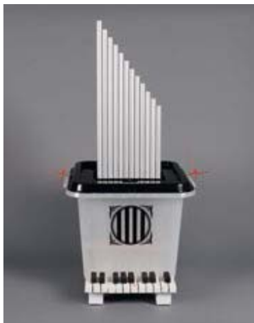
PASCAL COMELADE. 1955

El Republicòfon. En l'obra de Pascal Comelade, les expressions plàstica i musical tenen lligams molts forts. Aquí l'urna és un instrument de música que pren posició. El Republicòfon amb la nota si assenyalada ens guia cap a la República.