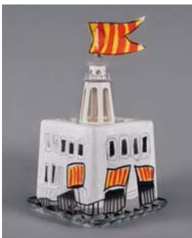
JACQUE BARRAL. Besiers, 1947

Plovía. « Plovía... 10.000 petits espais aixoplugats del mal temps, amagats curosament darrere el buit de la incertesa, emplenats d'emocions, sentiments, il·lusions, antigues passions, enyors d'un passat, enyors d'un futur. » Les paperetes « triturades » s'amunteguen com els dissenys de canvi esquixats.