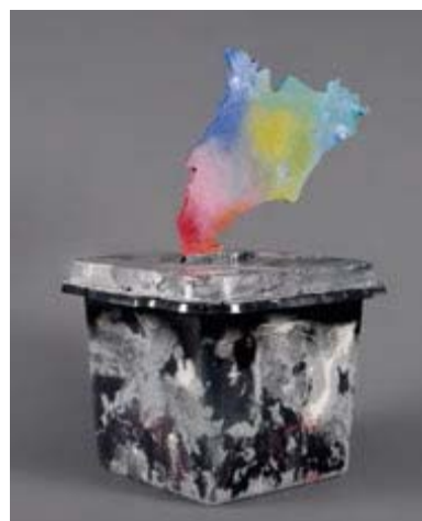
GERARD SALA. Tona, 1942

Catalunya 1 d'octubre del 2017. L'urna està recoberta dels diaris del 2 d'octubre, que es poden llegir des de l'interior, a fora el suport està totalment pintat. Una senyora gran amb una papereta a la mà és a punt de votar, envoltada per una multitud enfrontada a les forces policials. Significa la força de la unió de la gent davant la repressió.