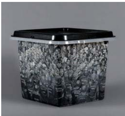
DOLORS RUSIÑOL MASRAMON. Vic, 1959

Catalunya 1 d'octubre del 2017. L'urna està recoberta dels diaris del 2 d'octubre, que es poden llegir des de l'interior, a fora el suport està totalment pintat. Una senyora gran amb una papereta a la mà és a punt de votar, envoltada per una multitud enfrontada a les forces policials. Significa la força de la unió de la gent davant la repressió.