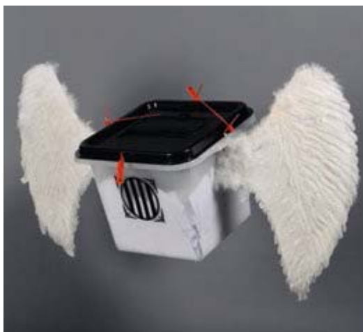
EMMANUELLE JUDE. Orleans, 1970 Voler de ses propres ailes. Una urna que té ales per volar cap a la llibertat. Quan la República catalana arrenca el vol, amb una mica d'imaginació, es pot sentir El cant dels ocells.