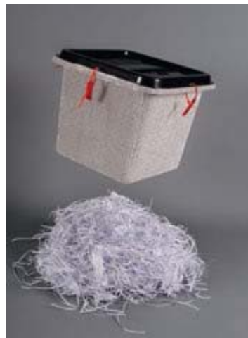
NÚRIA BATLLE. Barcelona, 1958

La democràcia triturada. L'urna ja només conté paperetes trinxades, com trinxada està sent la democràcia a Catalunya, la voluntat del poble passada per la trituradora... La trituradora de paper utilitzada per l'administració o les empreses serveix per fer impossible la lectura de les informacions que conté, esborra la memòria.