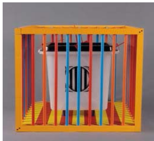
PERE BELLÉS. Terrassa, 1965

Bastion. « Imagino Catalunya d'aquesta manera: una fortalesa ferma i sòlida, que uneix les forces de la gent i les basteix com els castells humans, talment com un far o una construcció visible des de lluny, guanyant alçada i mantenint-se forta en les maltempades. »