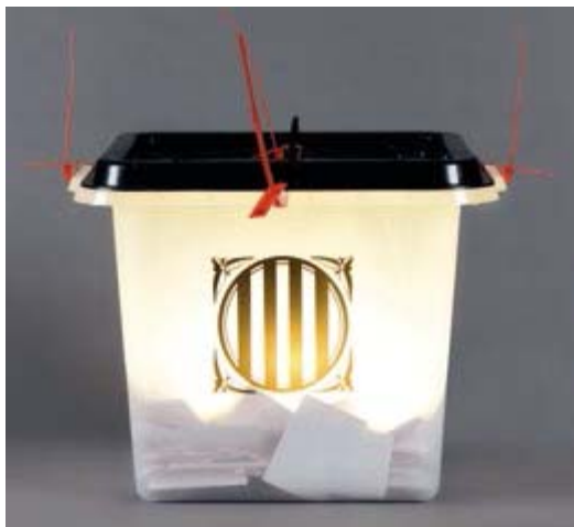
FABIEN BOITARD. Blois, 1973

Obsolescence. «Així que converteixo l'urna en un llum amb una vida útil de 1.500 hores tancada en aquesta urna plena de paperetes dipositades el dia de la votació catalana. Aquesta urna segellada en preservà el contingut fins al final de la seva vida. Com una obsolescència programada de la democràcia.»