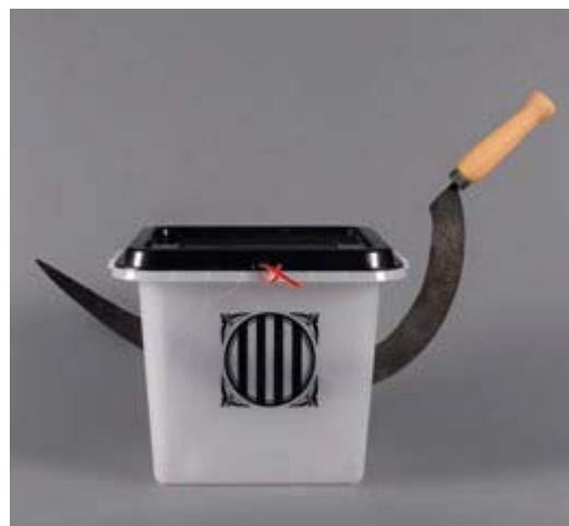
ENRIC PLADEVALL. Vic, 1951

La festa no és acabada. El procés com una festa... Les llums de la festa ens indiquen que aquesta encara no s'ha acabat, els colors múltiples, les esperances i les alegries d'un futur desitjat giren en silenci com a resposta als girofars blaus de la Guàrdia Civil.