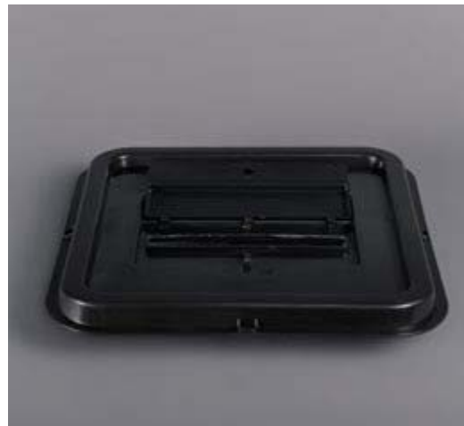
TOM CARR. Tarragona, 1956

Obsolescence. «Així que converteixo l'urna en un llum amb una vida útil de 1.500 hores tancada en aquesta urna plena de paperetes dipositades el dia de la votació catalana. Aquesta urna segellada en preservà el contingut fins al final de la seva vida. Com una obsolescència programada de la democràcia.»