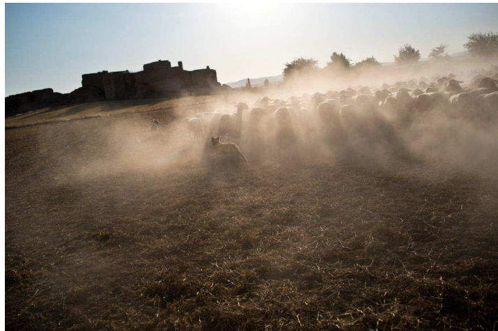
Campo de Calatrava, Calatrava la Vieja