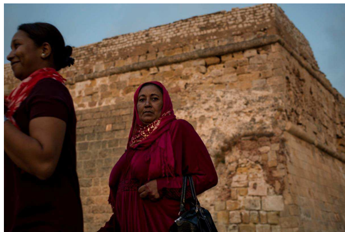
Túnez, Forte de la Goleta