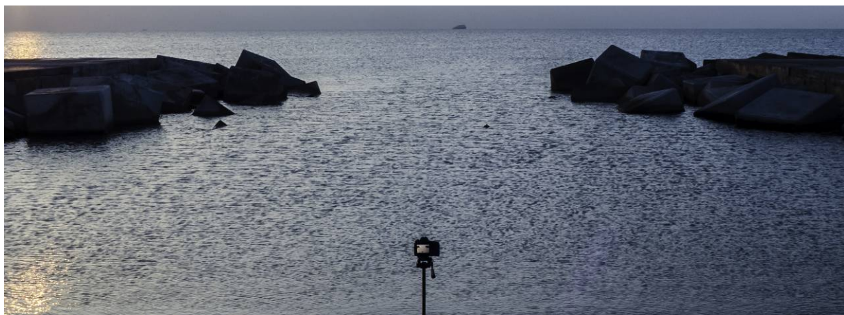
Adolf Alcañiz 'Autorretrat'