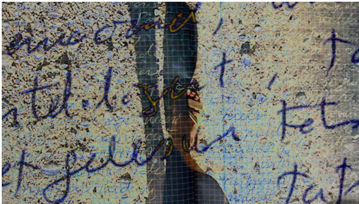
Rose Present. 'Textures d'un camí'