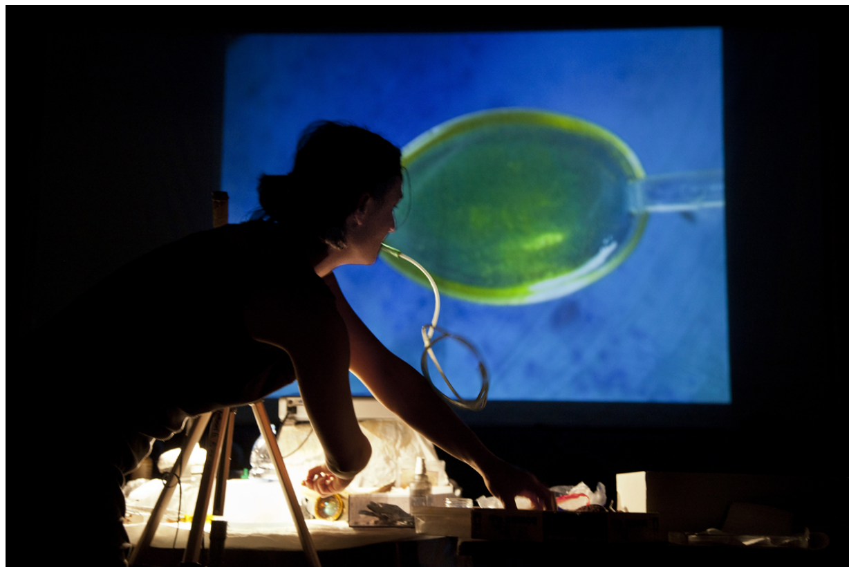
via Cherici & Masahiko Ueji 'Manucinema'